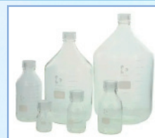
透明キャップ付き